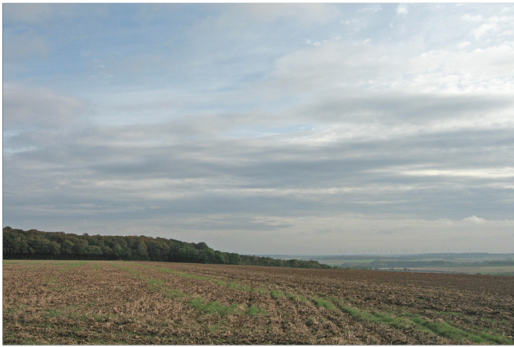
Eolienne n° 8 : Vue avant implantation