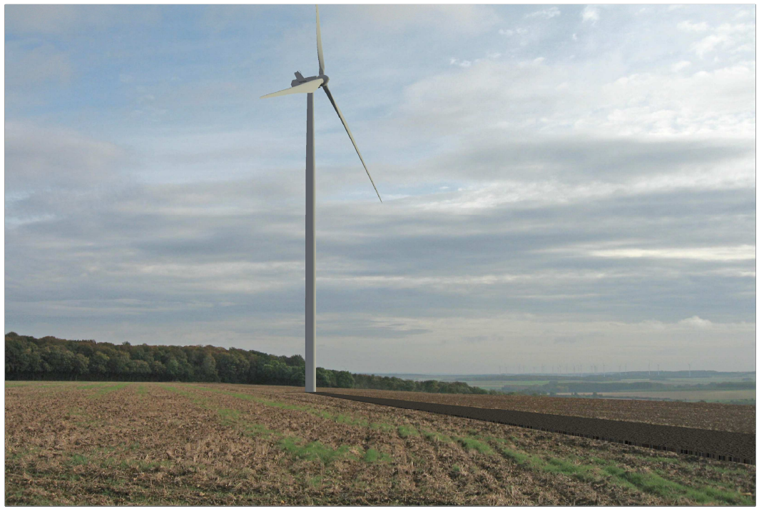
Eolienne n° 8 : Vue après implantation